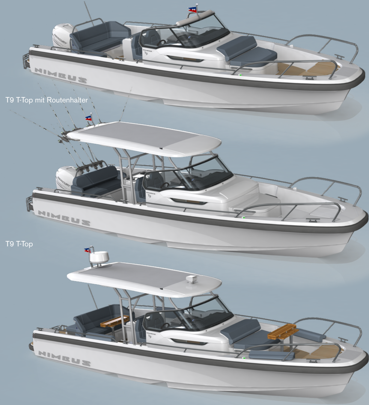
T9 T-Top mit Routenhalter